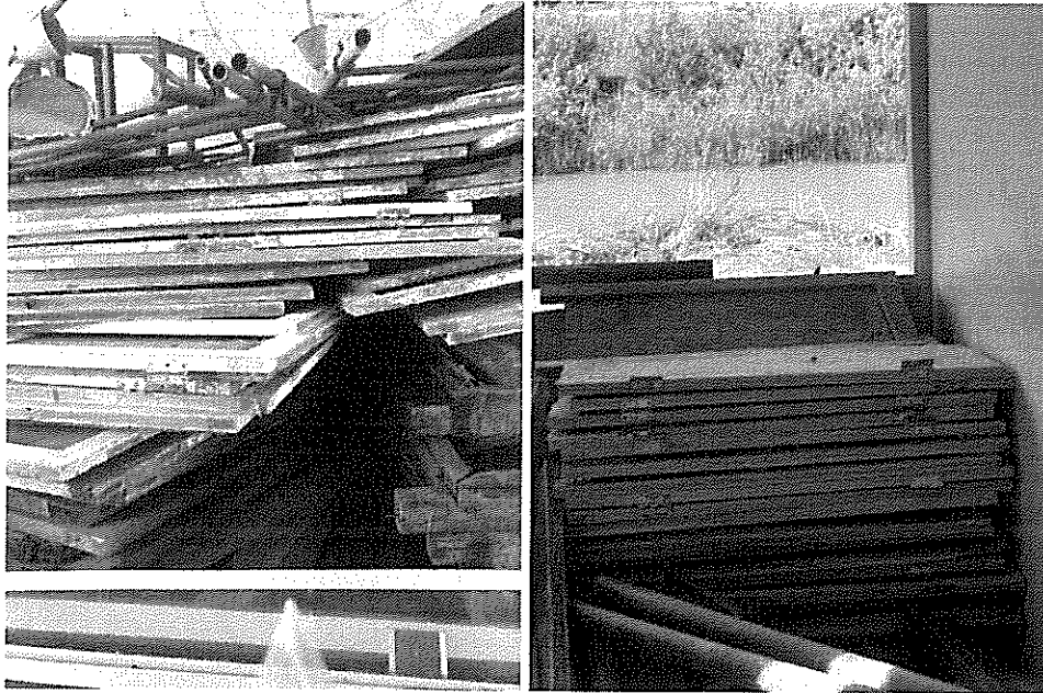
ภาพที่ ๑ บ้านหน้าต่าง