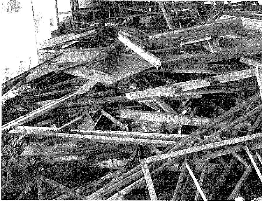
ภาพที่ ๓ เศษไม้