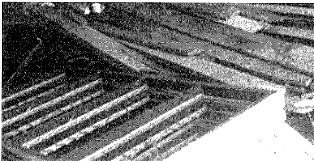
ภาพที่ ๔ วงกบหน้าต่าง