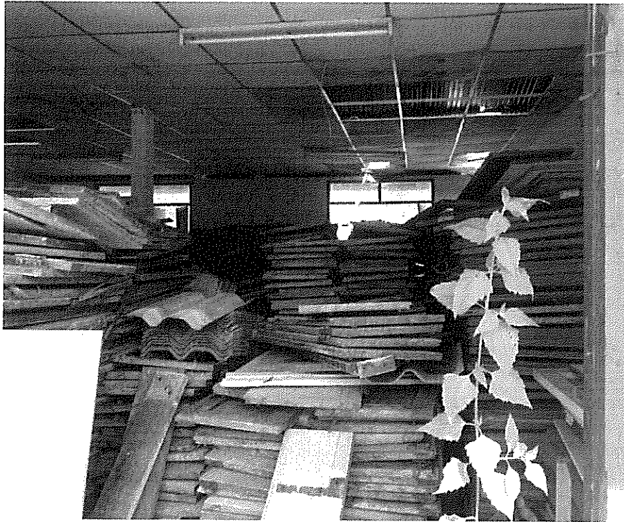
ภาพที่ ๗ บานหน้าต่าง