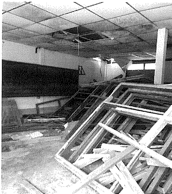
ภาพที่ ๘ เศษวงกบประตูและหน้าต่าง