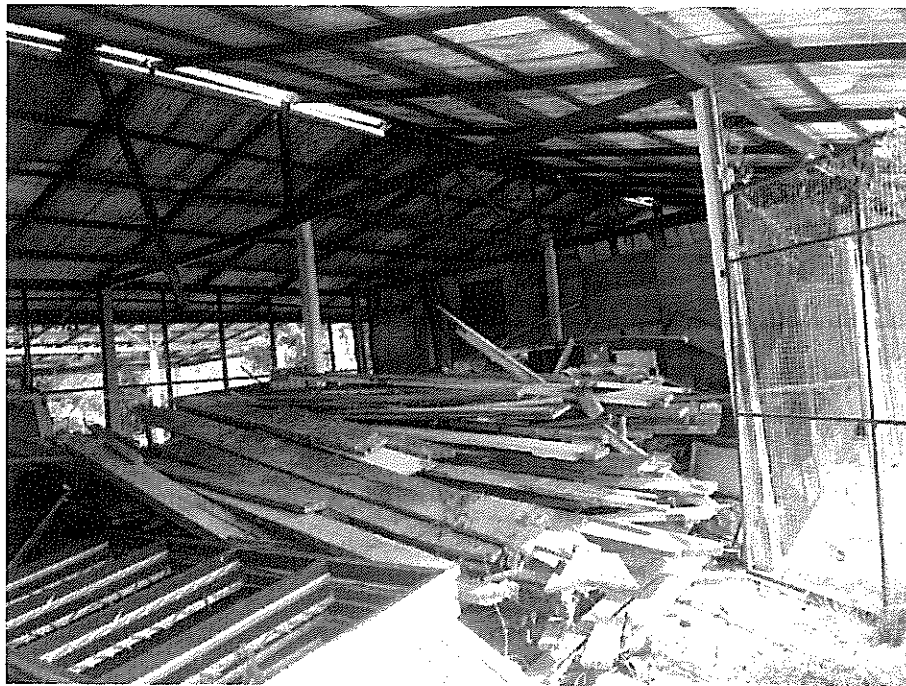
ภาพที่ ๔ เศษไม้