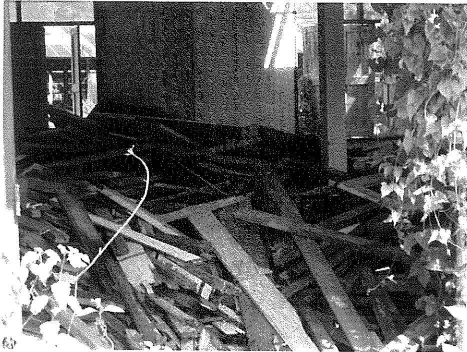
ภาพที่ ๙ เศษไม้